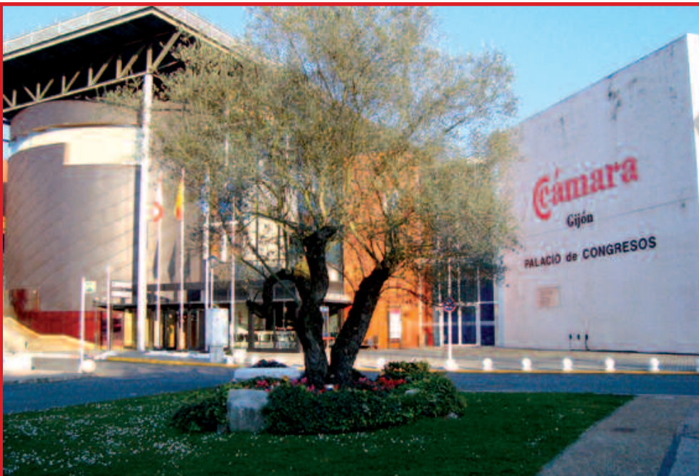
Vista exterior del Palacio de Congresos y Exposiciones “Luis Adaro” en las instalaciones de la Cámara de Comercio de Gijón

AsturFranquicia , Feria de la Franquicia en Asturias, celebrará los próximos días 21 y 22 de noviembre en Gijón su IV Edición. La Feria será el encuentro entre Centrales Franquiciadoras, Consultoras especializadas en Franquicia y emprendedores e inversores interesados en adherirse al sistema de Franquicia.