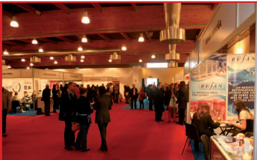
Vista interior de la “Sala Asturias”

AsturFranquicia tiene como objetivo ser el escaparate, el referente en el Norte de España del sector de la Franquicia, un escaparate generador de negocio para las empresas expositoras, plataforma de creación de autoempleo para emprendedores y motor de crecimiento e impulso para los pequeños empresarios y autónomos.